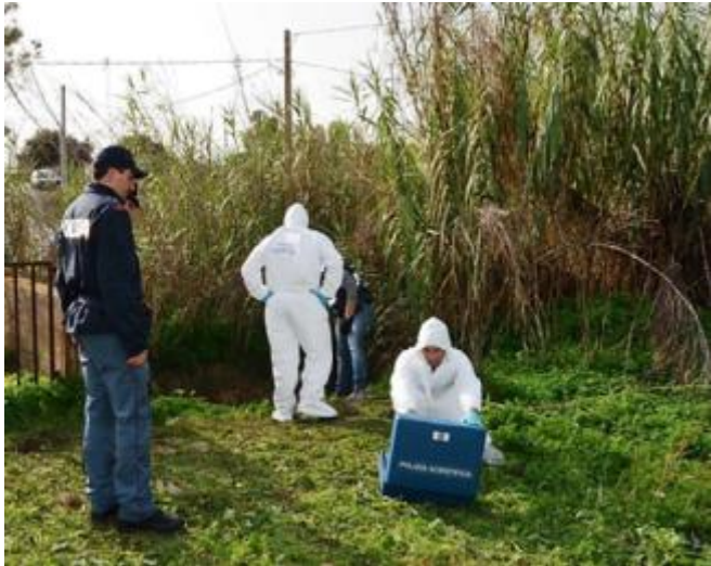
I rilievi della polizia nel luogo in cui è stato trovato il corpo di Loris

La video-ricostruzione realizzata dagli investigatori dura circa 30-40 minuti ed è stata fatta mettendo assieme tutte le immagini delle telecamere che inquadrano la mattina di