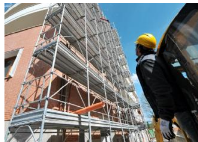
Un operaio in un cantiere edile

Per Verona, come per Venezia i ricavi sono in lieve crescita, +0,3%; a Rovigo salgono dello 0,1%. Il dato positivo è forse riconducibile al leggero incremento di ordini +0,7% per le imprese veronesi, il più elevato in Veneto. Tuttavia le aziende scaligere continuano a perdere posti di lavoro (-2,7%); l'emorragia non si registra a livello regionale, dove il saldo è invariato. Rispetto allo scorso anno sono le attività artigiane a soffrire maggiormente (-0,6%), mentre quelle più dimensionate segnano una variazione negativa quasi nulla (-0,1%). Stesso trend per