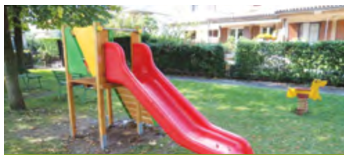
Parco giochi via Deledda, Palazzolo. Posa della nuova torretta scivolo e gioco a molla