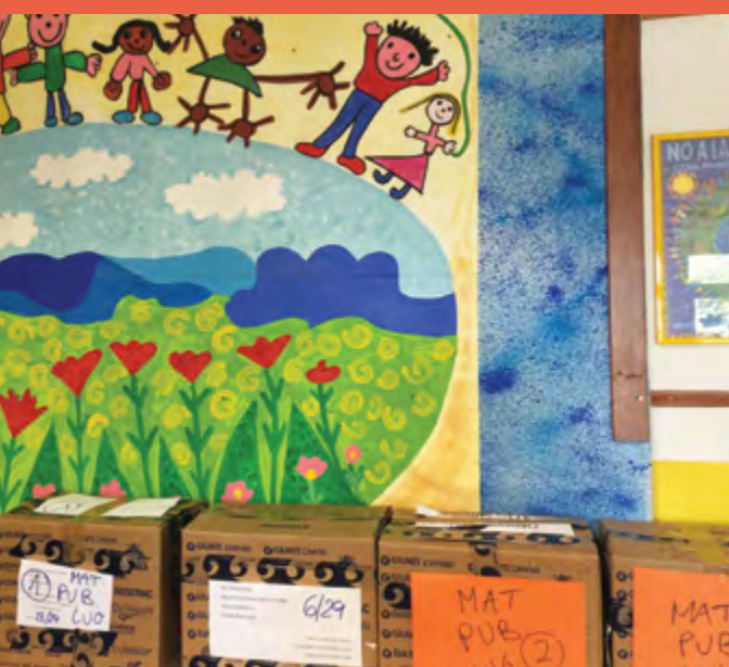
1.001 LIBRI DONATI ALLE SCUOLE