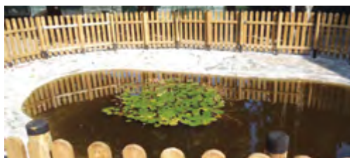
Realizzazione staccionata e pulizia dello stagno didattico alle scuole elementari di Sona, in convenzione con il Gruppo Alpini di San Giorgio