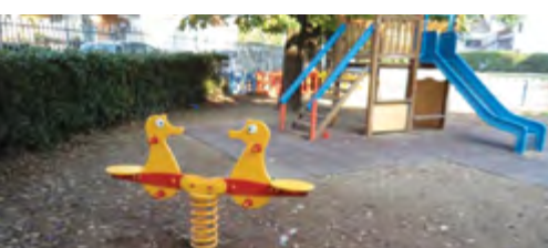
Posa di nuovi giochi alla scuola materna, Lugagnano. Gioco a molla