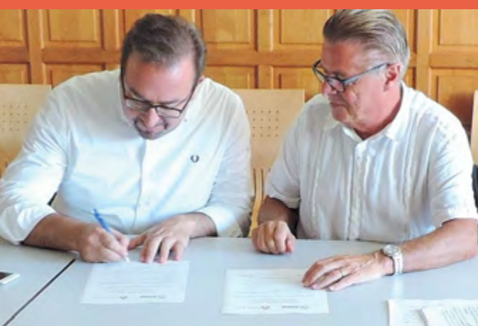
GEMELLAGGIO SOYAUX (FRANCIA)