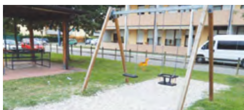
Casa di riposo, Lugagnano. Lavori di adeguamento dei giochi e posa tappeti anticaduta