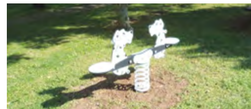
Parco giochi baita Alpini di San Giorgio in Salici. Posa del nuovo gioco a molla