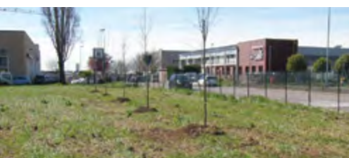
Aree verdi comunali e parchi gioco. Posa di oltre 90 nuove alberature