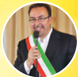
Gianluigi Mazzi Sindaco Comune di Sona

Nel 2016 investimenti di € 11.500.000 per scuole, casa di riposo, viabilità, sport, sicurezza, manutenzioni e molto altro.