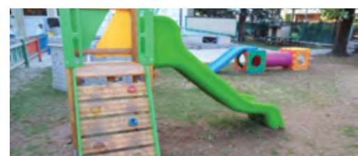
Posa di nuovi giochi alla scuola materna, Lu- gagnano. Posa di torretta con arrampicata