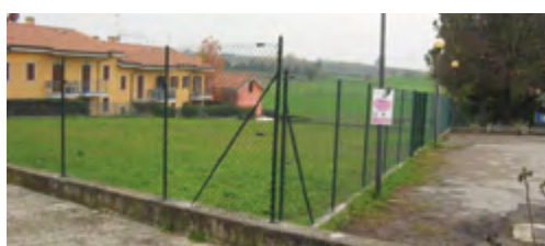
Completamento lavori nuova area cani di Sona in Via Donizetti, posa di nuove alberatu- re, fontanella e panchine