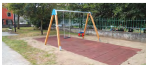
Parco giochi Traversa Via Pelacane, Lugagnano. Posa nuova altalena e sostituzione rete di protezione fondocampo