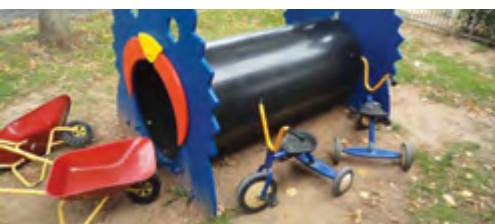
Asilo nido Arcobaleno Lugagnano Manutenzione con riverniciatura struttura giochi.