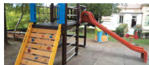
Scuola Materna di Sona (Villa Trevisani). Restauro scivolo con nuova scala/arrampicata, nuovi plinti di sostegno, manutenzione, riposizio- namento del tappeto anticaduta, risemina prato