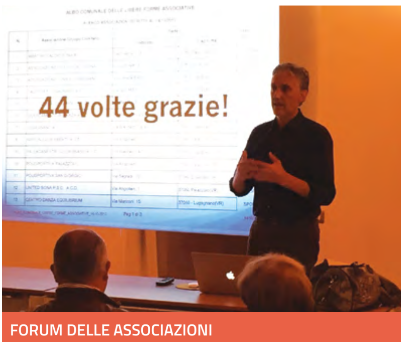
FORUM DELLE ASSOCIAZIONI