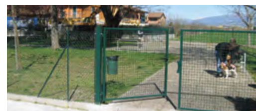
Via E. Fermi, Lugagnano. Realizzazione nuova area cani