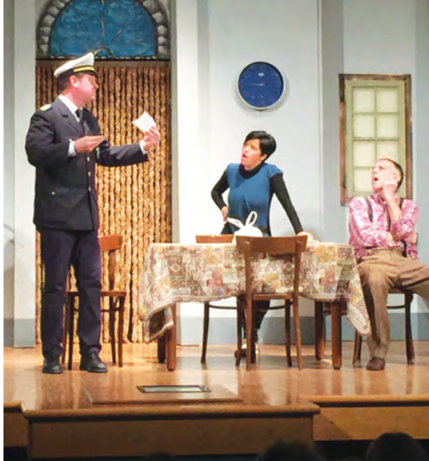
IL TEATRO E I CONCERTI IN PIAZZA