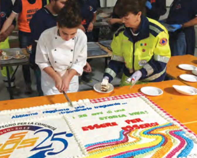
ANNIVERSARIO S.O.S 25 ANNI