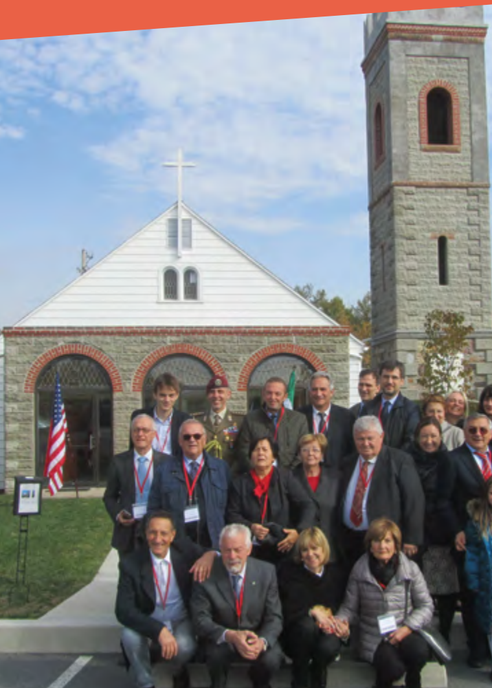
AUTORITÀ DI LETTERKENNY - CHAMBERSBURG