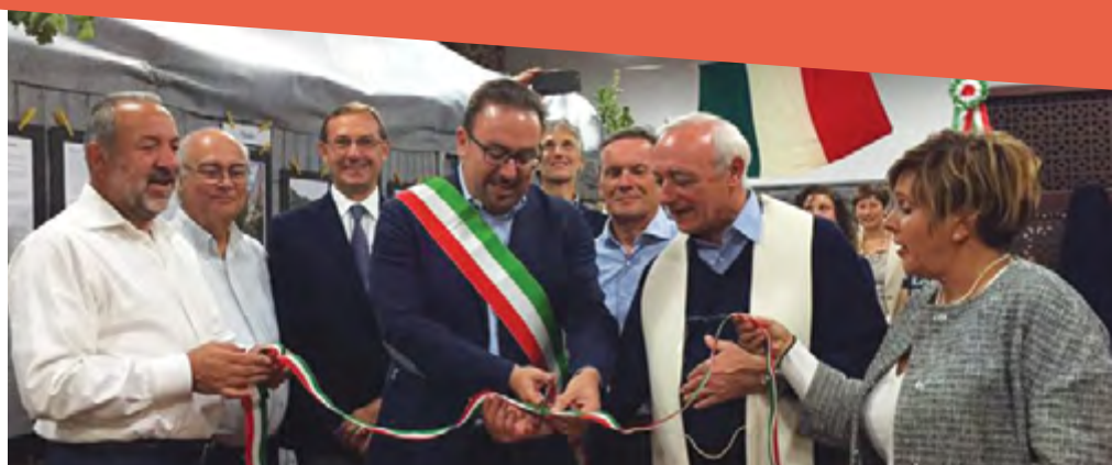
MOSTRA LA GRANDE GUERRA - SETTEMBRE