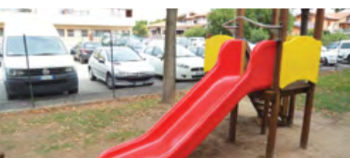
Asilo nido Arcobaleno, Lugagnano. Posa della nuova torretta a scivolo