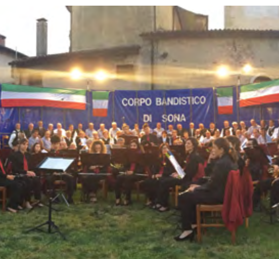
CONCERTO 2 GIUGNO