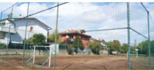
Parco giochi Via Aleardi-Brennero, Lugagnano. Posa della nuova rete di protezione